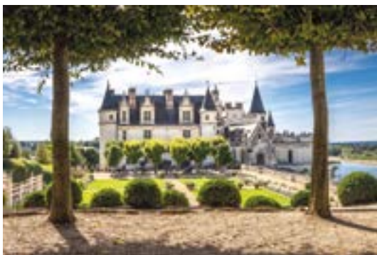
Les Châteaux de la Loire

Sur tous nos séjours : activités de loisirs, veillées, soirées à thèmes organisées par notre équipe d'animation sur place.