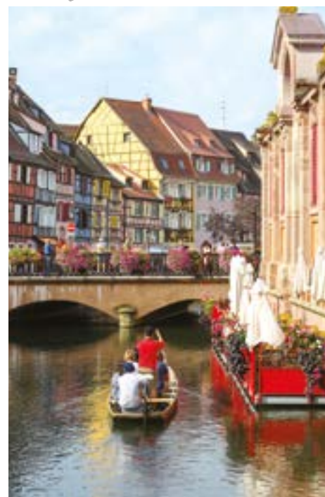
Colmar : La Petite Venise

Dates de séjour 02/08/2025 au 16/08/2025