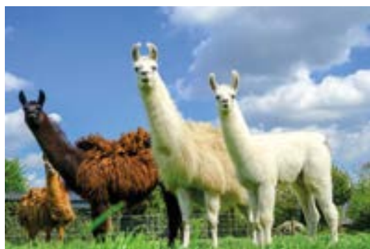
La ferme aux lamas : Balade et découverte

Sur tous nos séjours : activités de loisirs, veillées, soirées à thèmes organisées par notre équipe d'animation sur place.