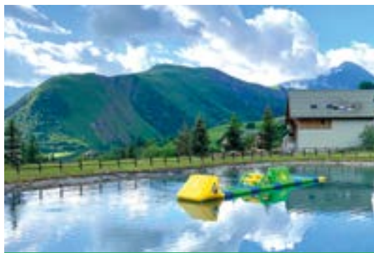
Lac d'altitude : Baignade et activités