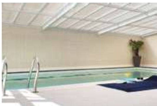
Piscine couverte et chauffée