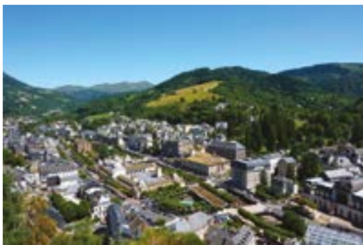
Respirez à La Bourboule

Sur tous nos séjours : activités de loisirs, veillées, soirées à thèmes organisées par notre équipe d'animation sur place.