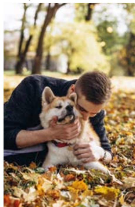
Cani-Rando: Partage et sensation