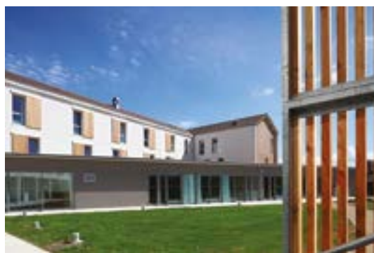
Votre résidence de vacances

Sur tous nos séjours : activités de loisirs, veillées, soirées à thèmes organisées par notre équipe d'animation sur place.