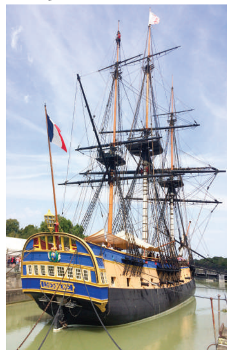
Visite de la frégate corsaire

Dates de séjour 29/07/2023 au 12/08/2023