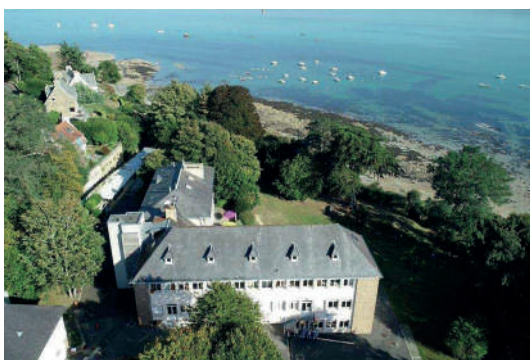
Votre centre de vacances en front de mer

Dates de séjour 29/07/2023 au 12/08/2023